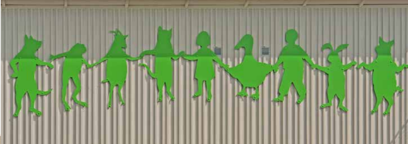
PATRIC LARSSON "IS" Skulptur, glas, målad mdf-board. Björlandahallen. © patric larsson/BUS 2013